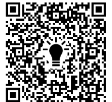
出店申込フォーム

③加工食品を販売する方は「食品営業許可書」のコピー。 ・ラポルテ五泉総合案内へ持参・郵送・FAX・メールにて。 ※アドレス等は下欄をご参照ください。