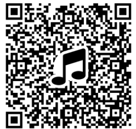
出店申込フォーム